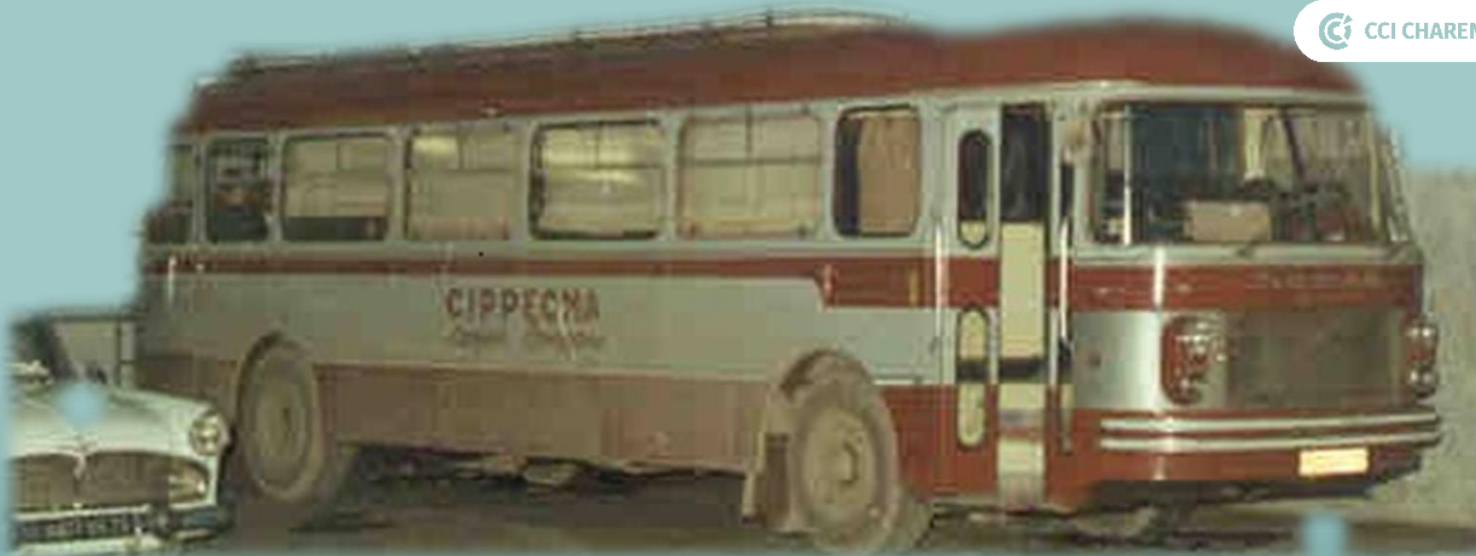
Le bus de Langues en 1967