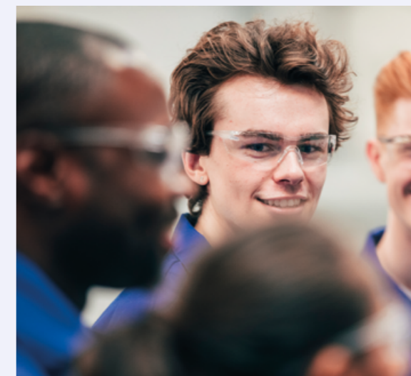
7 – Conférence des Grandes Écoles